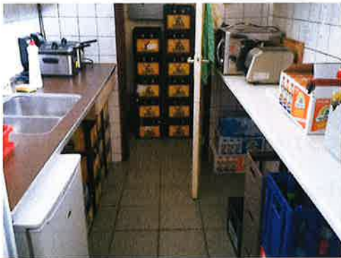
Keuken, te krap.

De keuken als geheel is dus sowieso aan een opknapbeurt toe.